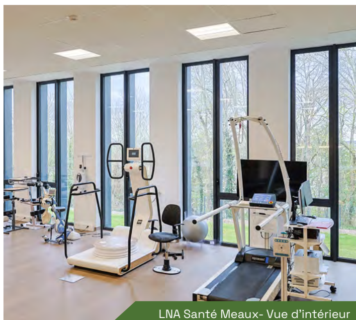
LNA Santé Meaux- Vue d'intérieur

*L'objectif (non garanti) de taux de distribution est basé sur la prise en compte d'hypothèses de marché arrêtées par la Société de Gestion. Il ne constitue pas un indicateur fiable de performance future et pourra évoluer à la hausse comme à la baisse.